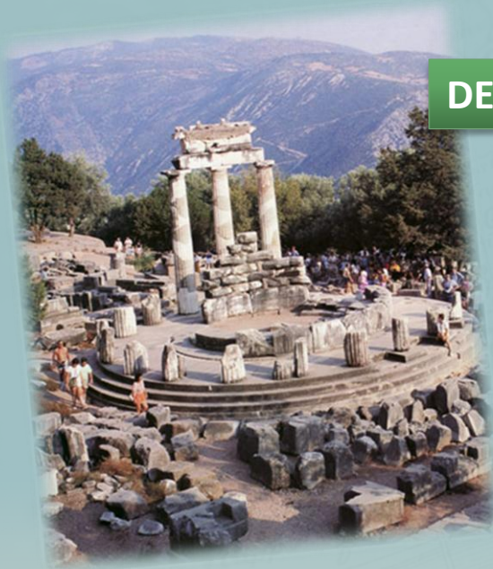
DELFI - WYROČNIA