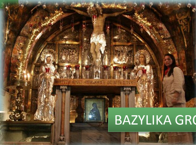
BAZYLIKA GROBU PAŃSKIEGO